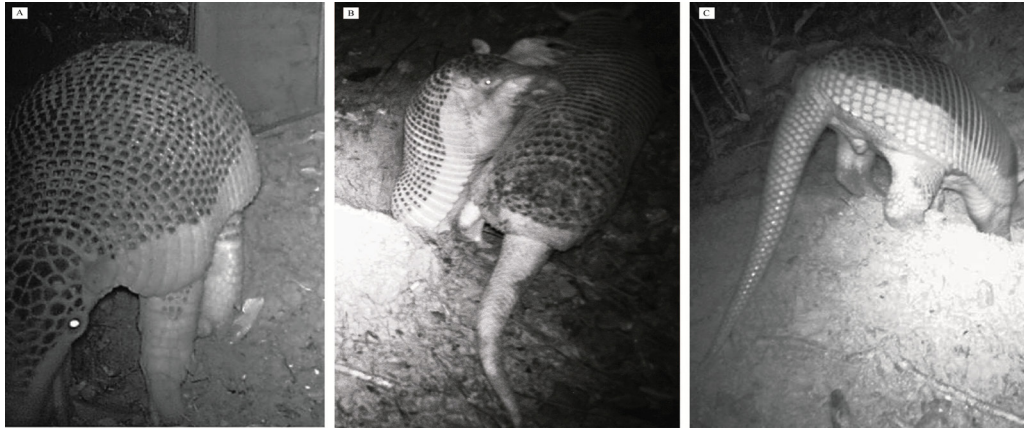
FIGURA 3. Ocarros ( Priodontes maximus ) en los bosques riparios de Puerto Gaitán (Meta-Colombia). A) Cría subadulto macho frente a una madriguera, segundo registro junto a su progenitora; B) Hembra adulta y su cría macho durante el comportamiento “garras sobre el dorso”; C) Subadulto macho.

tierra que había sido removida del exterior hacia el interior. Se instalaron dos trampas cámara para monitorear la entrada a las madrigueras. Al revisar los videos y fotografías obtenidos se observó que llegó una hembra y comenzó a excavar en este lugar desde las 23:04 hs hasta las 23:33 hs, horario en el cual se asomó la cabeza de la cría y luego fue saliendo lentamente todo su cuerpo ( FIGS. 2C, 2F ). Un video del Caso 3 está disponible en < https://www.youtube.com/watch?v=Q76K-txuWCo >.