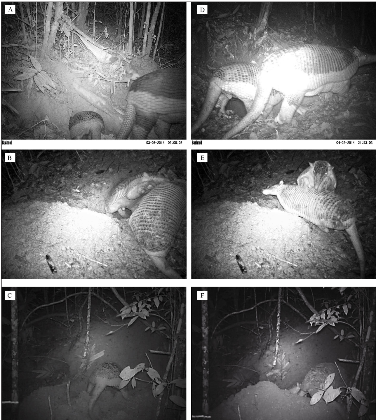
FIGURA 2. Registros del ocarro ( Prionotus maximus ) en los bosques riparios de Puerto Gaitán (Meta-Colombia). A) Hembra adulta y su cría macho inspeccionando la madriguera; B) Interacción entre hembra adulta y su cría macho; C y F) Hembra adulta excavando para sacar su cría de la recámara subterránea; D) Hembra adulta y su cría macho caminando por una senda; E) Cría macho con las garras sobre el dorso de su progenitora.

En esta área, el relieve se compone en un 90% de planicies y un 10% de serranías. La precipitación promedio anual es de 2.300 mm y la temperatura atmosférica varía de 24 °C a 30 °C (Cicery et al. , 2005). La zona corresponde al pedobioma de sabana tropical estacional, caracterizado por sabanas extensas y vegetación boscosa restringida a bosques de galería (pedobioma freatófito; Hernández-Camacho & Sánchez, 1992).